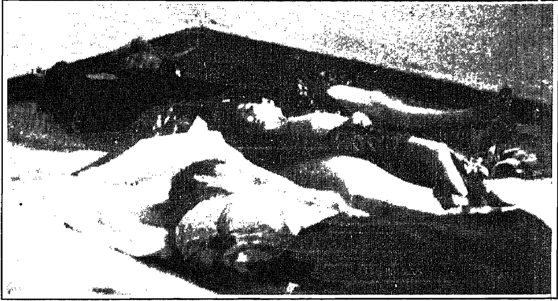
من ضحايا الإرهاب الأصولي

● هاجم أصوليون باصاً مدرسياً شرق الجزائر وقتلوا ثلاثة أشخاص وأصابوا سبعة عشر طالباً بجراح (الديار ٢٠/٥/٩٥).