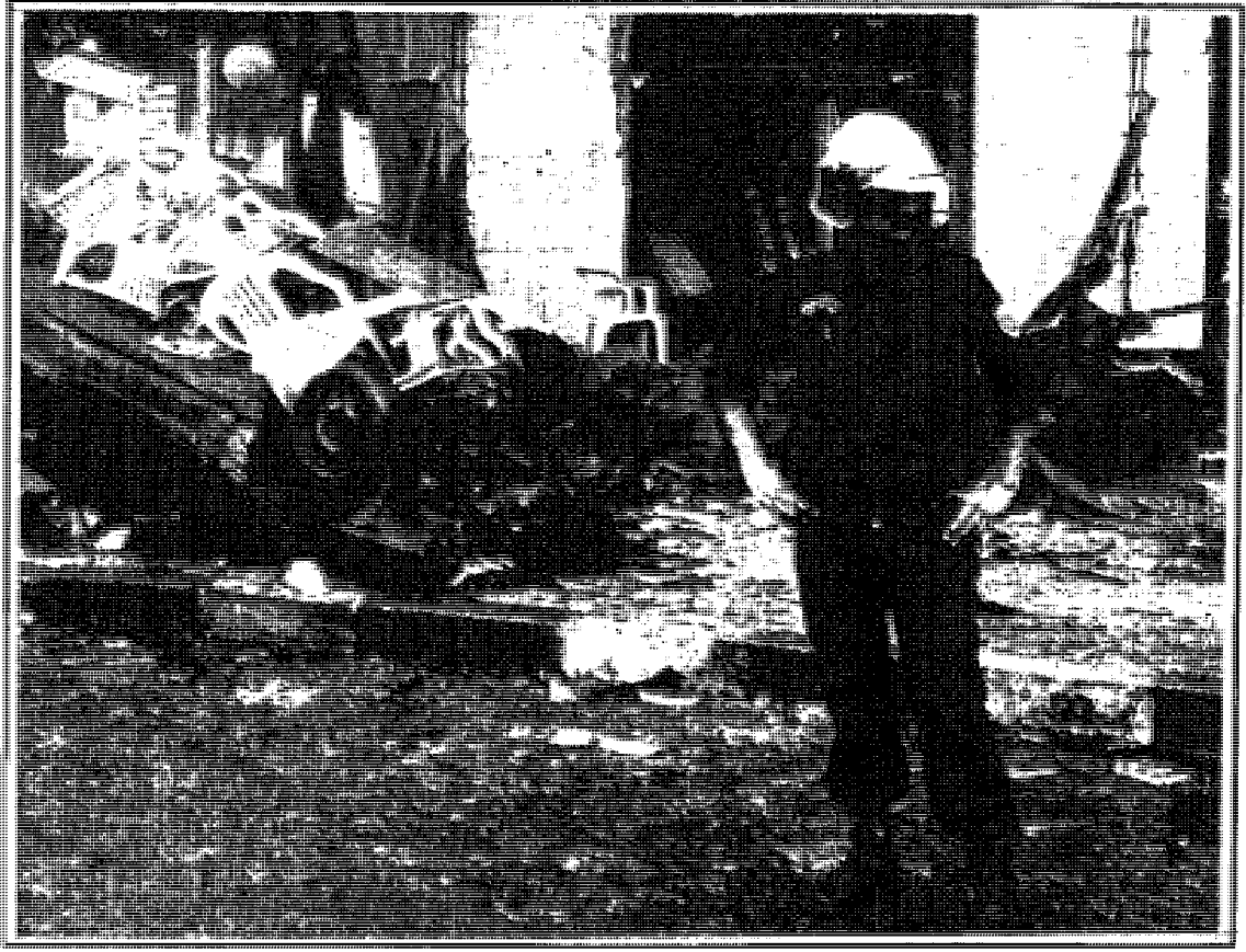
آثار انفجار أصولي في الجزائر

إلى المجلس الدستوري المكلف إعلان شغور سدة الرئاسة ما يلي: «إنَّه لا يهرب من المسؤولية لكنَّه اختار سبيل المصلحة العليا للأمة».