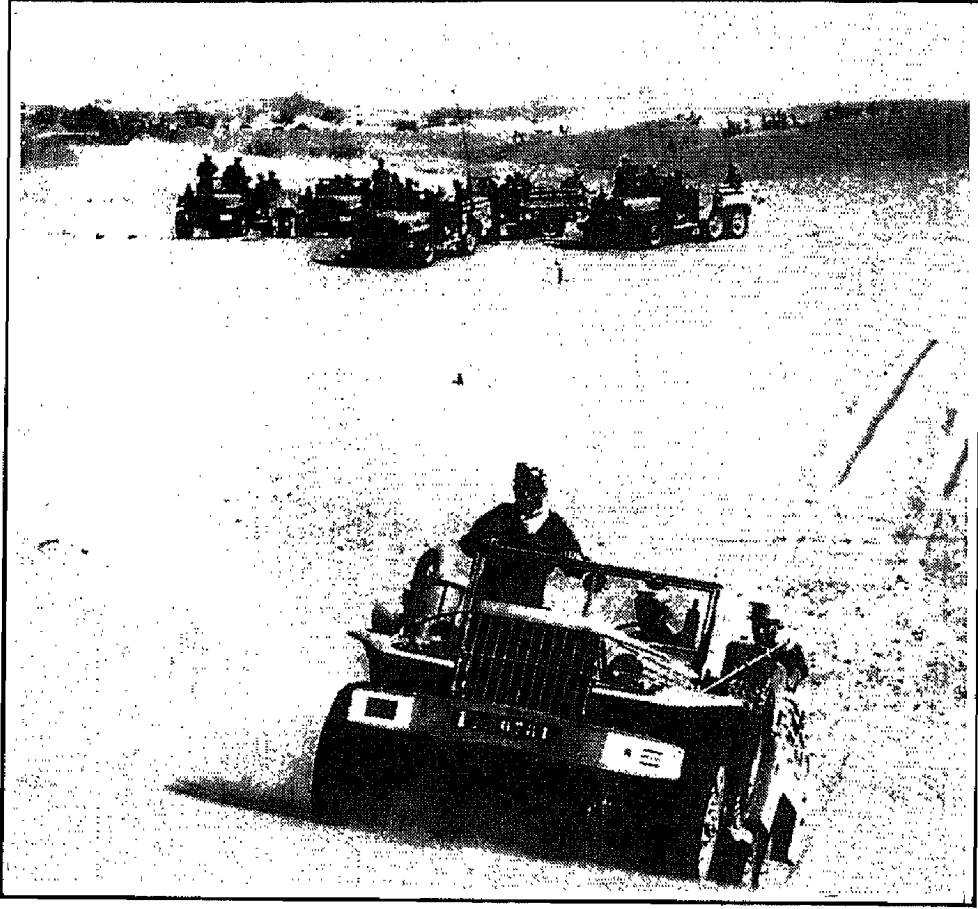
قوة فرنسية في صحراء الجزائر

سنة ١٩٤٥ سيبقى نقطة التحوّل الكبير في تاريخ الثورة الجزائرية الكبرى، وقد كان فعلاً بداية نهاية الإحتلال والخطوة الأولى الكبيرة في مسيرة التحرير والإستقلال.