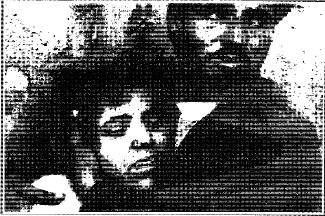
الخوف على الحياة والمستقبل

سَقَطَنَ العام الماضي . وأكثر اللواتي قُتِلْنَ تعرَّضْنَ للإغتصاب ، ومثَّلَ القتلَ بهنَّ . واحتجز عدد كبير آخر من النساء أشهراً طويلة ، وأرغمنَ على ما يُسمَّى «زواج المُتعة» مع عناصر الجماعات المسلَّحة في معسكراتهم .